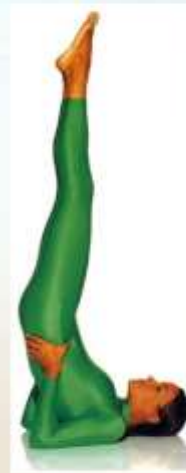
Стойка на лопатках