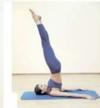
Стойка на лопатках без опоры рук