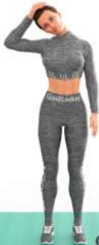
1. Наклон для растяжки шеи