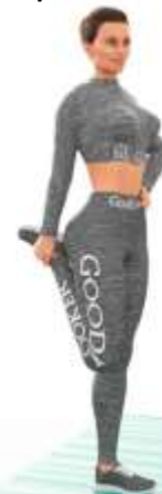
5. Растяжка квадрицепсов