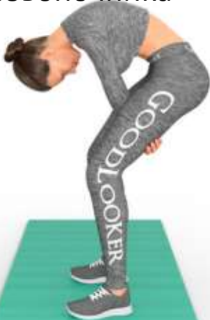
4. Растяжка позвоночника