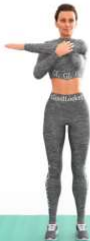
2. Растяжка плеч