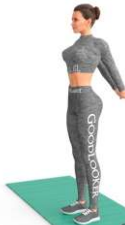
3. Растяжка груди и рук