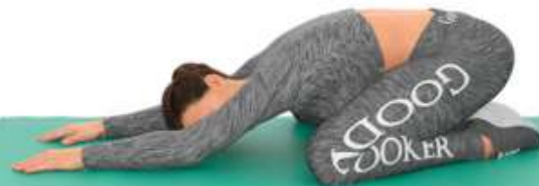
7. Поза ребенка