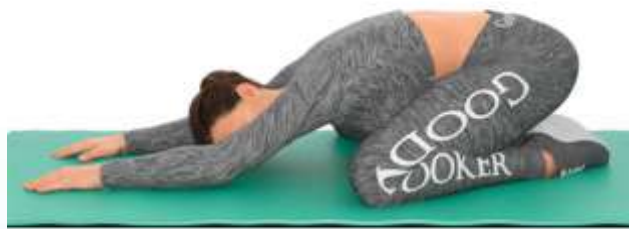
7. Поза ребенка