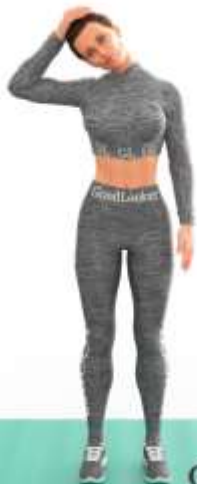
1. Наклон для растяжки шеи