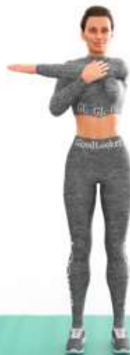
2. Растяжка плеч