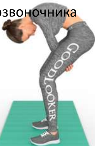
4. Растяжка позвоночника