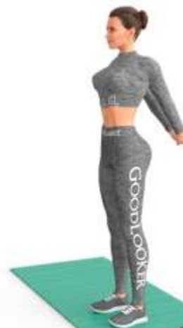
3. Растяжка груди и рук